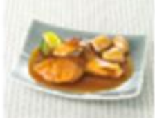
赤魚の素焼き 甘酢あんかけ