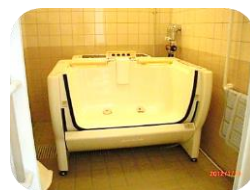
扉自動開閉式機械浴槽