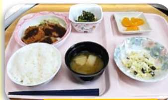
健康的で家庭的な大人気の昼食です♪