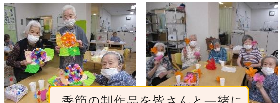
季節の制作品を皆さんと一緒に